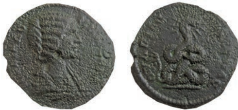
31. Јулија Домна (193-211) Бронза, Пауталија, 193-211 Ав. ΙΟΥΛΙΑ ΔΟ-ΜΝΑ СЕΒ Рев. ΟΥΛΠΙΑΣ ΠΑΥΤΑΛΙΑС ΑΕ; 14,8 г.; 30мм; ↗ Мушмовъ, 4218 Инв.бр. 1/608