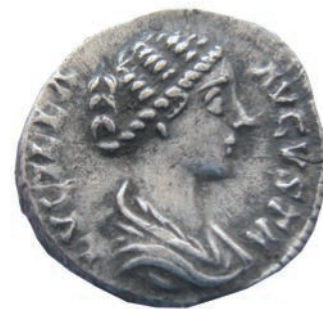
Лукила, денар, Рим, 164 - 169 г., аверс (AR; 3,28 г.; 19 мм; ↑) Инв.бр. 1/733