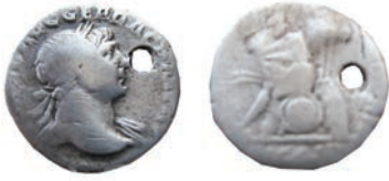
Трајан (98-117) 39.Денар, Рим,108г. Ав.IMP TRAIANO AVG GER DAC (PM TRP) Рев.(COS V PP SPQR OPTIMO PRINC) AR; 2,87 г.; 18мм;↖ RIC,98 Инв.бр.1/155