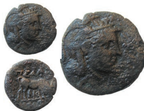
Пела 18.Бронза,187/6-168/7 г. пр.н.е. Ав.Глава на Атина Партенос, со шлем, надесно Рев.ΠΕΛ/ΛΗΣ Крава пасе,надесно,м. AK АЕ;6,40;20мм;↑ SNG. Сор.266-275 Инв.бр.1/132