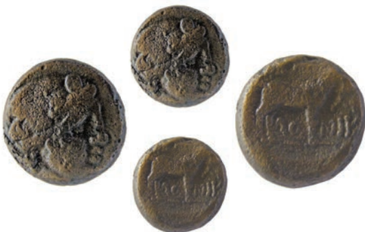
Тесалоника 8.Бронза,187/6-168/7 г.пр.н.е. Ав.Глава на Дионис со бршленов венец,надесно Рев.(ΘΕΣΣΑ)ΛΟΝΙΚ (ΗΣ) Коза,надесно AE; 9,75г.;17мм;✓ SNG.Сор.,365-366 Инв.бр.1/138