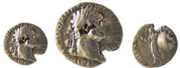
Домитијан (81-96) 38.Денар, Рим, 88-89 Ав. IMP CAES DOMIT AVG GERM PM TRP V(III) Биста на императорот со лоровенец, надесно Рев. IMP XIX COS ( XIII CENS PPP) Претстава на Минерва, налево, во рацете држи молња и копје AR; 2,86 г.; 19мм; ✓ RIC, 669 Инв.бр. 1/153