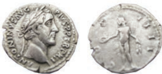
Антонин Пиј (138-161) 41.Денар, Рим,148-149 Ав.ANTONINVS AVG PIVS PP TR P XII Рев.COS IIII AR; 2,74г.; 18мм;↖ RIC,175 Инв.бр.1/454