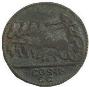
Лукиј Вер (161-169) 45.Сестертиј,(AE;38мм;15,8г.;↙) Инв.бр.1/671