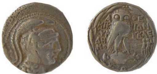
7.Тетрадрахма,Атина,168-50г.пр.н.е. Ав.Глава на Атина Партенос со атички шлем,надесно Рев.ΑΘΕ, Буф стои на панатејска амфора ΜΙΚ-ΙΩΝ ΕΥΡ-ΥΚΛΕ ΔΗ-ΜΟ AR;15,0г.;29мм;✓ Thompson, No.487a Инв.бр.1/183