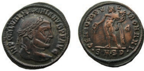
Максимијан Херкулиј (285-310) 57.Фолес,Сердика,307/8 Ав.IMP C VAL MAXIMIANVS PF AVG Рев.GENIO POP-L-I ROMANI Во д.поле E;Во отс.SM •SD АЕ;11,15 г.; 29мм;↓ RIC,38 Инв.бр.1/441