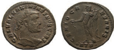
Максимин II Даја (305/8-313) 58.Фолес,Хераклеа,308/9 Ав.GAL VAL MAXIMINVS NOB CAES Рев.GENIO CA-ESARIS Во отс.НТВ АЕ ;9,20 г.; 28мм;↓ RIC,Но.36а Инв.бр.1/489