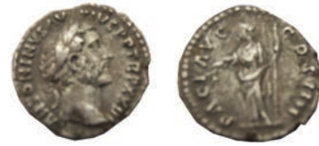
Антонин Пиј (138-161) 42.Денар,Рим,156-159 Ав.ANTONINVS AVG PIVS PP TR P XXIII Рев.PAX AVG COS III AR; 3,42 г.; 18мм;↓ RIC,III,301 Инв.бр. 1/468