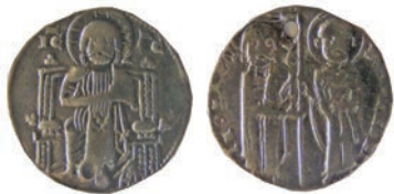
Венеција Јакопо Контарини (1275-1280) 80.Silver grosso Ав. IC-XC Исус Христос на трон,со нимбус со крст Носи туника и дивитисион,со десна рака благословува,во лева држи евангелие Рев. IA.QTARINO D/V/X SM.VENETI AR; 2,19 г.; 20 мм;↓ Инв.бр.1/445