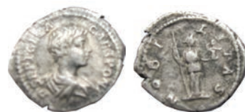
Гета (199-211) 47.Денар, Рим, 200-202 Ав.Р SEPT GETA CAES PONT Рев.NOBILITAS AR; 2,43 г; 20мм;↙ RIC,IV,13 Инв.бр.1/470