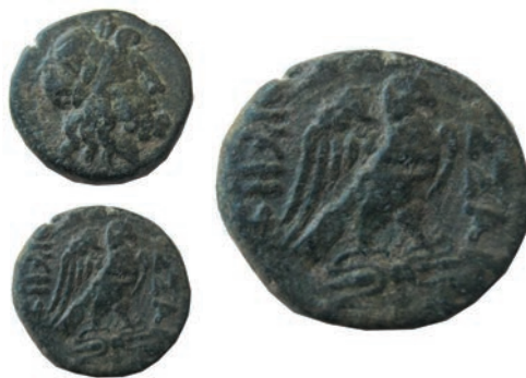
14.Бронза,187/6-168/7г.пр.н.е. Ав.Глава на Зевс со лоровов венец, надесно Рев.ΘΕΣΣΑ-(Λ)ΟΝΙΚΗΣ Орел со раширени крилја,надесно АЕ; 7,23г.; 21мм; ↓ SNG. Сор.367 Инв.бр.1/798