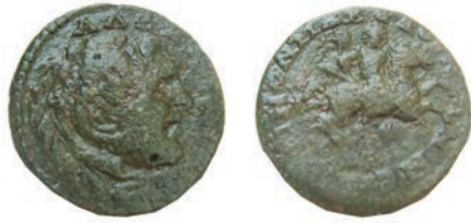
24.Бронза,238-244 Ав. ΑΛΕΞΑΝΔΡΟΥ Глава на Александар Велики со лавовска кожа, надесно Рев.ΚΟΙΝΟΝ ΜΑ-ΚΕΔΟΝΩΝ Коњаник АЕ;10,64г.;26мм Gaebler (1906),423a Инв.бр.1/431