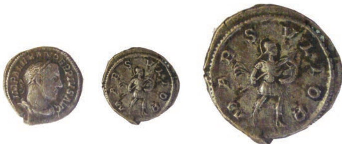
Александар Север (222-235) 50.Денар, Рим, 232 Ав.IMP ALEXANDER PIVS AVG Рев.MARS VLTOR АР; 3,58 г.; 20мм; ↓ RIC,246 Инв.бр.1/472