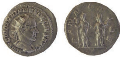
51. Трајан Декиј (249-251) Антонинијан, Рим, 249-251 Ав. IMP C M Q TRAIANVS DECIVS AVG Рев. PANONIAE AR; 3,94 г.; 22мм; ↘ RIC, IV, (3), 23 Инв. бр. 1/87