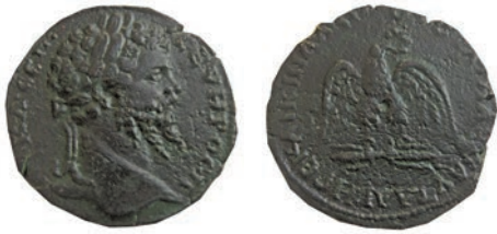
30. Септимиј Север (193-211) Бронза, Пауталија, 193-211 Ав. (AV) КЛ СЕП СЕВΗΡΟΣ Π Рев. ΗΓΕ ΚΑΙΚΙΝΑ ΛΑΡΓΟΝ ΟΥΛΠΙΑΣ ΠΑΥΤΑΛΙ ΑΕ; 14,9 г.; 27мм; ↗ Мушмовъ, 4189 Инв.бр. 1/609