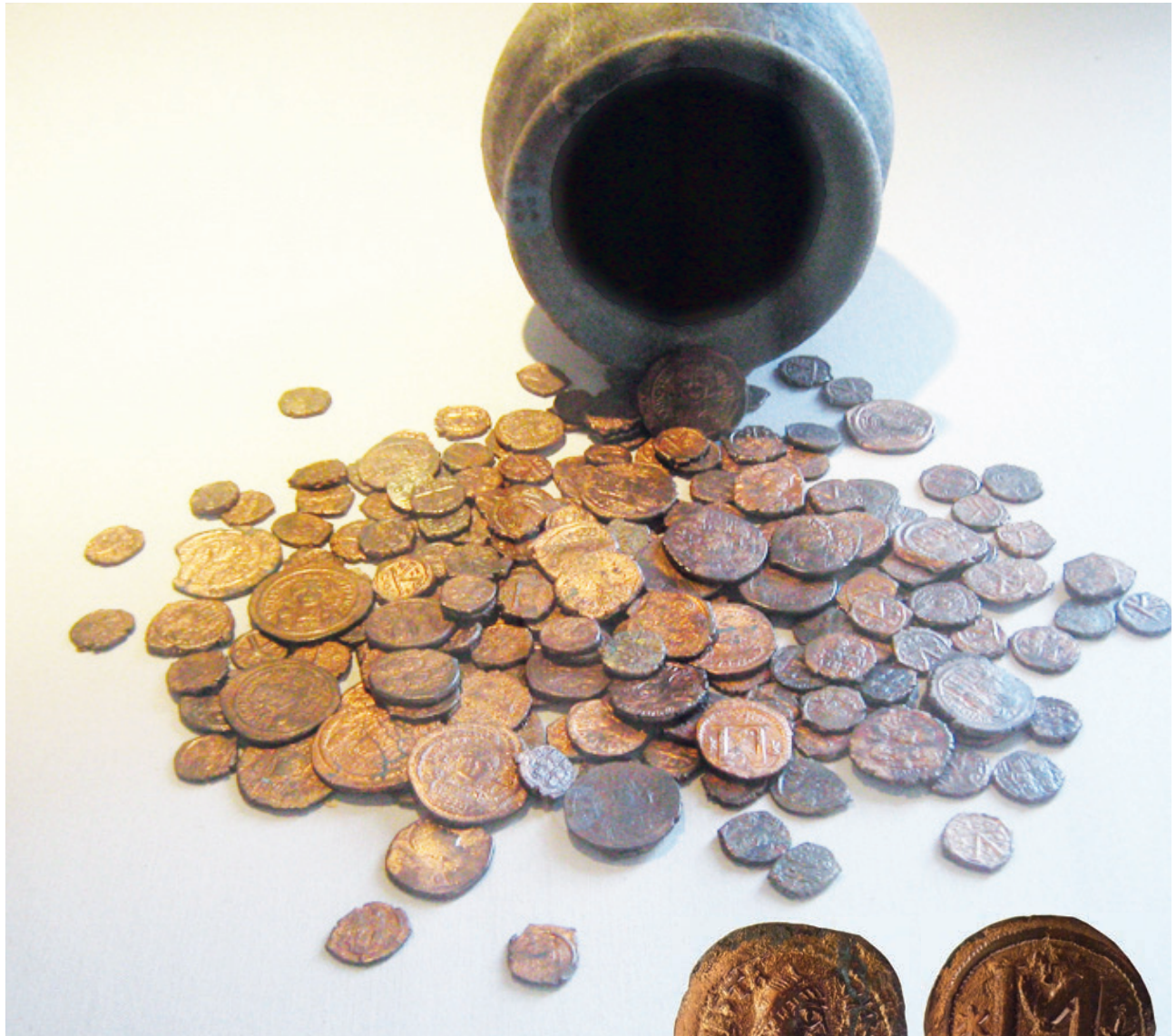
Анастасиј I, фолис, Константинопол, 512/17