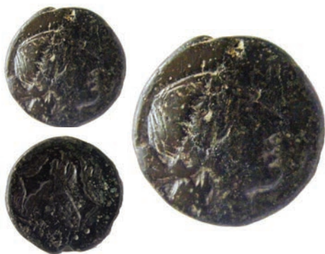
17.Бронза,187/6-168/7г.пр.н.е. Ав.Глава на Артемида со тенија,надесно Рев.ΑΜΦΙΠΟΛΙΤΩΝ Два јарци еден спроти друг АЕ;7,93г.;21мм;↙ SNG. Сор.62 Инв.бр.1/466