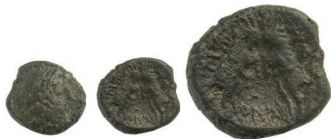
11.Бронза,187/6-168/7г. пр.н.е. Ав.Глава на Зевс,надесно Рев.(ΘΕ)-ΣΣ-(ΑΛ)-ΟΝΙΚΕΩΝ Две кози, една спроти друга AE;7,03г.;20мм;↓ SNG. Сор.,350 Инв.бр.1/238