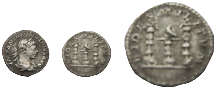
Елегабал 49.Денар,Рим,219-220 Ав.IMP ANTONINVS PIVS AVG Рев.FIDES MILITVM АР; 2,78г.;19мм; ↑ RIC,78v Инв.бр.1/471