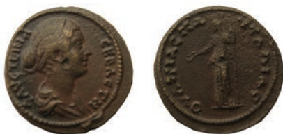
32. Фаустина II (161-175) Бронза, Пауталија, 161-175 Ав. ΦΑΥΣΤΕΙΝΑ СЕΒΑΣΤΗ Биста со драперија, надесно Рев. ΟΥΛΠΙΑС ΠΑ-ΥΤΑΛΙΑС Стоечка претстава на Деметра, налево во една рака држи рог на изобилие, во друга долго копје ΑΕ; 6,4 г.; 23 мм; ↓ Мушмовъ, 4106; Ruzicka, 69-72 Инв.бр. 1/660