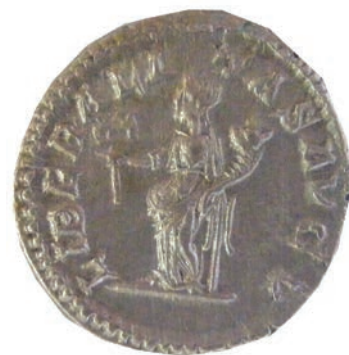
Liberalitas (симбол на даржливост на императорот)