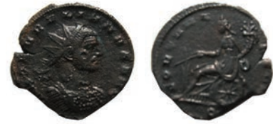
Аврелијан (270-275) 54. Антонинијан, Медиоланум, 274/5 Ав. IMP AVRELIANVS AVG Рев. FORTUNA (REDVX) Во отс. Q АЕ; 2,67 г.; 21мм; ↓ RIC, 128 Инв. бр. 1/279