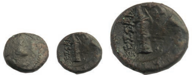
10.Бронза,187/6-168/7 г.пр.н.е. Ав.Претстава на Артемида Рев.(ΘΕΣΣΑ)ΛΟΝΙΚΗΣ Во средина лак и тоболец AE;5,19г.;18мм;✓ SNG. Сор.356-359 Инв.бр.1/195