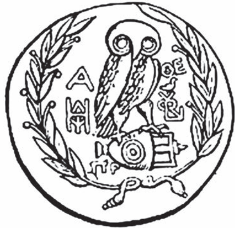
Буф, заштитен симбол на Атина

Презентираниот нумизматички материјал во една систематизирана целина дава слика на еден континуиран развој за историјата на парите, како археолошки и уметнички предмет, и еден од првите облици на масовно производство, средство за размена, но и носител на општествените вредности.