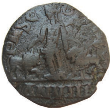
36. Филип I, 246/7г. Персонификација на колонијата Виминациум, меѓу бик (симбол на VII- Клавдиева) и лав (IV-Флавиева римска легија) (АЕ; 16,3г.; 29мм; ✓ Инв.бр. 1/54)