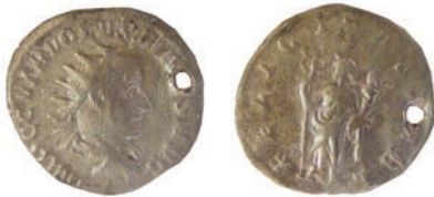
Волусијан (251-253) 52. Антонинијан, Рим, 251-253 Ав. IMP CC VOLVSIANVS AVG Биста со радијална круна, надесно Рев. IOVI CONSERVAT AR; 5,4г.; 23 мм; ↖ RIC, IV(3), 198 Инв. бр. 1/93