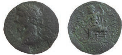
28.Марк Аврелиј (161-180г.) Стоби,161-180 Ав.ΙΜ Μ ΑΥ ΑΝΤΟΝΙΝΥΣ ΓΣ Рев.ΣΤΟΒΕΝ-ΣΙΜΜ АЕ;12,1г.; 24мм;↑ Мушмовъ,6537 Инв.бр.1/692