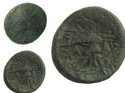
19.Бронза,187/6-168/7г. пр.н.е. Ав.Глава на Пан, надесно Рев. ΠΕΛ/ΛΗΣ Фигура на Атина Алкидемос, надесно,лево монограм АЕ;4,89г.;18мм;↙ SNG. Сор.258 Инв.бр.1/258