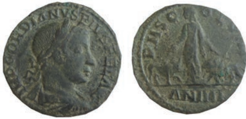
35.Бронза, Виминациум, 242/3 Ав. IMP GORDIANVS PIVS FEL AVG Биста на императорот со лоровенец, надесно Рев. PMS C-OL VIM AN III Персонификација на колонијата Виминациум меѓу лав и бик АЕ; 18,34 г.; 30мм; ✓ Pick 83 Инв.бр. 1/474