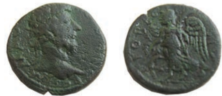
29.Стоби,161-180 Ав.ΙΜ Μ ΑΥ ΑΝΤΟΝΙΝΥΣ Рев.ΣΤΟ-ΒΕΝ-ΣΙΜΜ (GS) АЕ;11,9 г.; 26 мм;↑ Мушмовъ,6536 Инв.бр.1/691