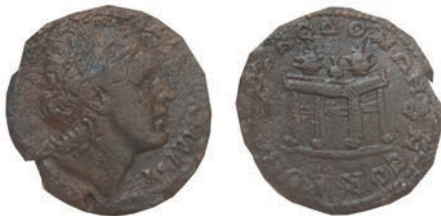
26.Бронза,238-244 Ав. ΑΛΕΞΑΝΔΡΟΥ Глава на Александар Велики надесно Рев.ΚΟΙΝΟΝ ΜΑ-ΚΕΔΟΝΩΝ Ν СΟR АЕ;10,97г.;27мм Gaebler (1906), 602 Инв.бр.1/429