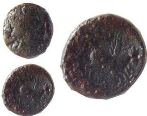
12.Бронза,187/6-168/7г.пр.н.е. Ав.Глава на Дионис со бршленов венец,надесно Рев.(ΘΕ)ΣΣΑ(Λ-Ο)ΝΙΚ(ΕΩΝ) Пегаз,надесно АЕ;6,3г.;21мм; ↓ SNG. Сор.351 Инв.бр.1/143