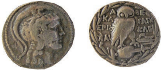
6.Тетрадрахма,Атина, 168-50г.пр.н.е. Ав.Глава на Атина Партенос,со атички шлем, надесно Рев.ΑΘΕ,Буф стои на панатејска амфора, ΚΑ-ΡΑΙΧ ΕΡΓΟ- ΚΛΕ (Χ)ΑΙ AR;15,3г.; 30мм;✓ Thompson,5336 Инв.бр.1/451