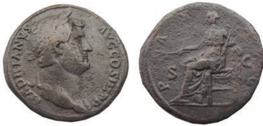
Хадријан (117-138) 40.Сестертиј,Рим,134-138 Ав.HADRIANVS AVG COS III PP Рев.PAX AVG S.C. AE; 24.56 г.; 33мм;↖ Инв.бр.1/70