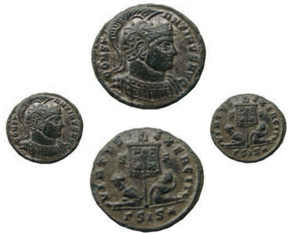
Константин I 60.Фолес,Сисциа,320 Ав.CONST-ANTINVS AVG Рев.VIRTVS EXERCITI VOT/XX Во отс. *GSIS* АЕ; 2,5 г.; 19мм;✓ RIC,VII,127 Инв.бр.1/481