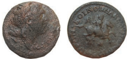
25.Бронза, 238-244 Ав.ΑΛΕΞΑΝΔΡΟΥ Биста на Александар Велики,надесно Рев.ΚΟΙΝΟΝ ΜΑΚΕΔΟΝΩΝ ΟΜΟΝΟΙ Коњаник АЕ;14,90г.;26мм Gaebler (1906), 423a Инв.бр.1/434