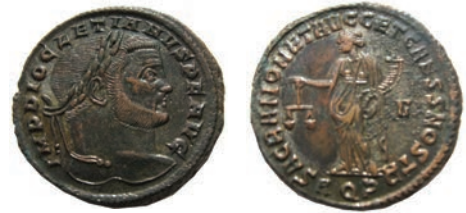
Диоклецијан (284-305) 55. Фолес, Аквилеа, 301 Ав. IMP DIOCLETIANVS PF AVG Рев. SACRA MONET AVGG ET CAESS NOSTR Во отс. AQP АЕ; 11,25 г.; 27мм; ↑ RIC, 31a Инв. бр. 1/439