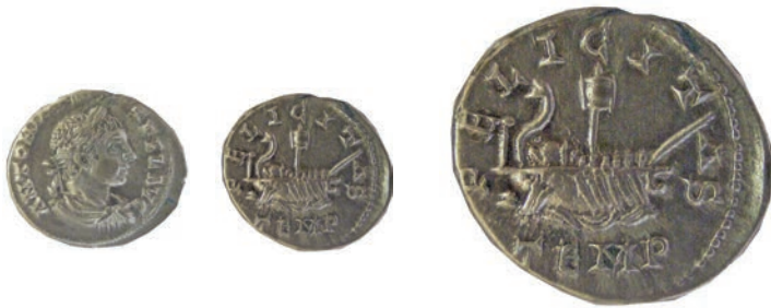
Елегабал (218-222) 48.Денар,Антиохија,222 Ав.ANTONINVS PIVS FEL AVG Рев.FELICTAS TEMP АР; 3,21 г.; 19мм;↓ RIC,IV(2),188 Инв.бр.1/95