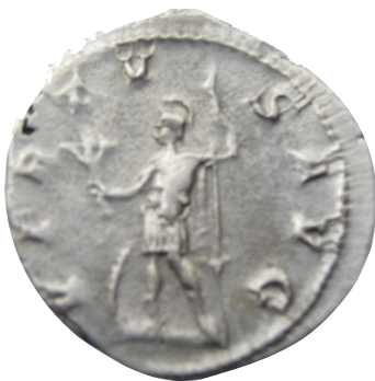
53. Гордијан III (238-244) (Virtus-војничка симболика на императорот) AR; 3,95г.; 22мм; ↓ Инв. бр. 1/16