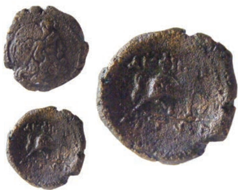
16.Бронза, 187/6-168/7г.пр.н.е. Ав.Глава на Посејдон,со тенија,надесно Рев.ΑΜΦΙΠΟ–ΛΙΤΩΝ Коњ во од, надесно АЕ;4,92;19мм;↖ SNG. Сор.65 Инв.бр.1/197