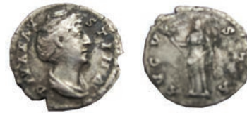
Фаустина (138-141) 43.Денар,Рим,141 Ав.DIVA FAV-STINA Биста на Фаустина,надесно Рев.AVGV-STA Керара стои налево,во д.рака држи факел, во лева скиптар AR; 3,08г.; 18мм;↓ RIC,III,116 Инв.бр. 1/469