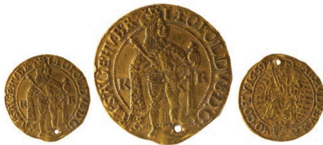
Леополд I, дукат, Австрија, 1659 (AV; 3,4 г.; 22 мм; ↑) Инв.бр.1/737