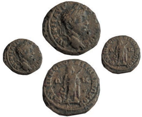
Елегабал (218-222) 33. Бронза, Филипол, 218-222 Ав. ΑΥΤ Κ ΜΑΥΡ ΑΝΤ-ΩΝΕΙΝΟС Рев. ΦΙΛΙΠΠΟΛΕΙΤΩΝ ΝΕΩΚΟΡΩΝ ΑΕ; 4,0 г.; 19мм; ✓ Мушмовъ 5419 Инв.бр. 1/666