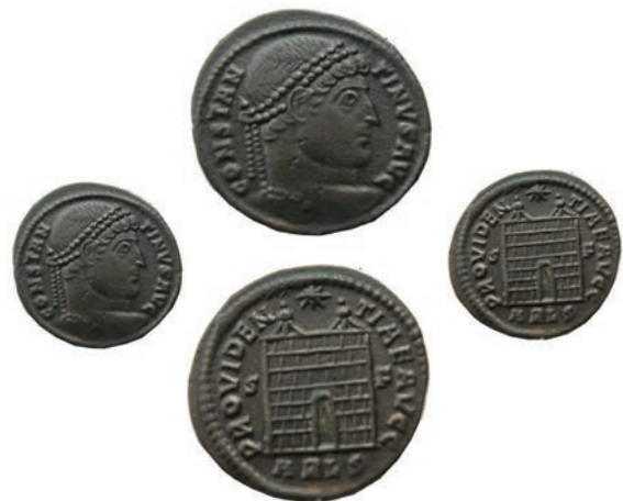
Константин I 61.Ае3,Арл,327 Ав.CONSTANTINVS AVG Рев.PROVIDEN-TIAE AVGG Во л.поле S, д.поле F; Во отс. ARLS АЕ; 3,0г.; 20мм;↓ RIC,VII,Но.309 Инв.бр.1/32