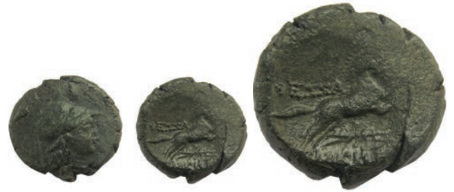
9.Бронза,187/6-168/7г.пр.н.е. Ав.Глава на Атина со шлем, надесно Рев.ΘΕΣΣ(ΑΛΟΝΙΚΗΣ) Коњ во скок,под него палмина гранка AE; 6,19г.;19мм;✓ SNG. Сор.,349 Инв.бр.1/243