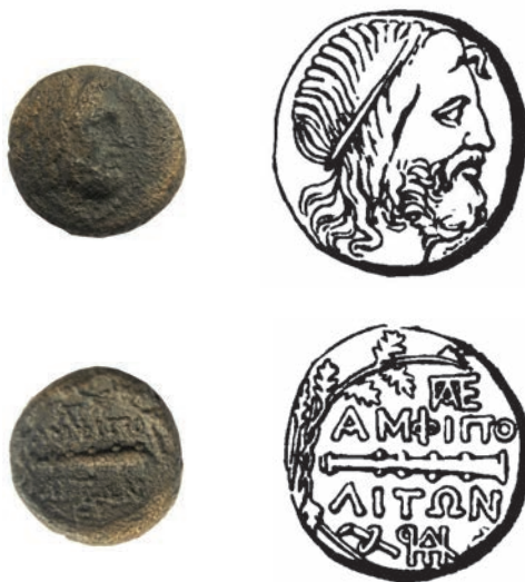
Амфиполис 15.Бронза,187/6-168/7 г.пр.н.е Ав.Глава на Посејдон,надесно Рев. ΑΜΦΙΠΟ/ΛΙΤΟΝ Суровица во дабов венец АЕ;7,42г;19мм;↑ SNG. Сор.52-56 Инв.бр.1/140