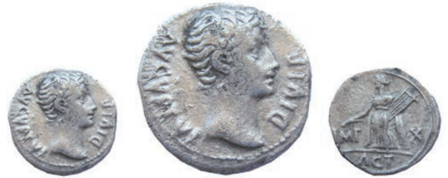
Октавијан Август (14г.пр.н.е.-31г.) 37.Денар, Рим, 15-13 г.пр.н.е. Ав. AVGVSTVS DIVI F Глава на императорот, надесно Рев. Претстава на Аполон, налево лево IMP, десно X; Во отс ACT AR; 3,75 г.; 20мм; ↓ RIC, 171a Инв.бр. 1/885