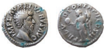
Лукиј Вер (161-169) 44.Денар,Рим,161 Ав.IMP L AVREL VERVS AVG Рев.PROV DEOR TR P COS II AR; 3,27 г.;18мм;↘ RIC,463 Инв.бр.1/157