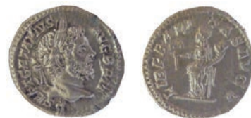
Гета (199-211) 46.Денар, Рим, 211 Ав.Р SEPT GETA PIVS AVG BRIT Рев.LIBERALI-TAS AVG V AR;3,40г;19мм;↑ RIC,88 Инв.бр. 1/74