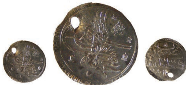
Ахмед III, (1703 - 1730, AX 1115 - 1143) Пара (AR; 0,50 г., 17 мм) Инв.бр.1/280