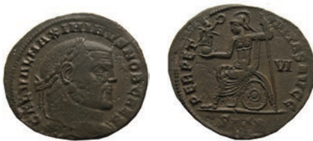
59.Фолес,Хераклеа,305-7 Ав.GAL VAL MAXIMINVS NOB CAES Рев. PERPET-VITAS AVG Во д.поле VI;Во отс. SIS(B) АЕ; 11,1 г.; 28мм;↑ RIC,Но.1826 Инв.бр.1/488