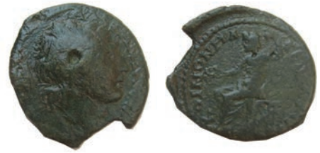
27.Бронза,231-235 Ав.ΑΛΕΞΑΝΔΡΟΥ Рев.ΚΟΙΝΟΝ ΜΑ-ΚΕΔΟΝΩΝ Зевс седи, налево,држи патера во десна и скиптар во лева рака АЕ;9,58г.;27 мм;↙ Gaebler (1906),341 Инв.бр.1/432