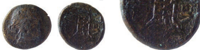
Пела, бронза,187/6-168/7г. пр.н.е. (АЕ;9,40г.;22мм;↗) Инв.бр.1/135