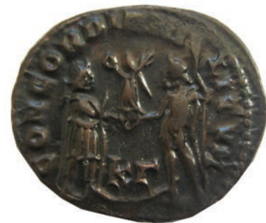
56. Диоклецијан, фолес, Кизик, 295/6 г. (Concordia militum-слога на војниците) Инв. бр. 1/138