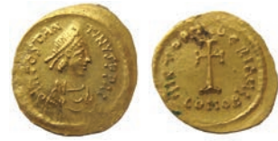
Тибериј II тремиз, Константинопол, 578/82 (AV; 1,46 г.; 17 мм; 1)