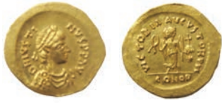
Јустин II тремиз, Константинопол, 565/78 (AV; 1,49 г.; 17 мм; 1)