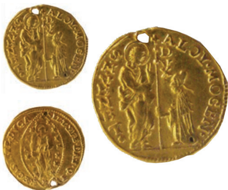
81.Алвисе IV Моцениго (1763-1778) Zecchino, Венеција Ав. ALOY.MOCEN.SM VENET DVX Стоечка претстава на св.Марко на лево, како го крунисува дуждот, надесно Рев.SIT.T.XPE.DAT.Q.TV REGIS ISTE DVCA Претстава на Христос, околу 16 ѕвезди AV; 3,4 г ; 22мм;↓ CNI,VII,P.500,Но.125 Инв.бр. 1/734